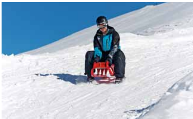
Un freinage correct pour plus de sécurité

A peine les premiers flocons tombés, enfants, adolescents ou adultes attrapent leur luge ou leur bob pour dévaler les chemins et les pentes. Dans les écoles, l'enseignement se déplace parfois sans plus attendre dans la nature. Le plaisir est toutefois gâché par les quelque 11 000 blessés annuels, en majorité des enfants ou des adolescents. Nombre de ces accidents pourraient pourtant être évités.